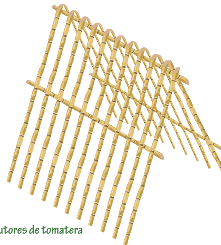
Tutores de tomatera

Hay muchos objetos cotidianos que podemos reutilizar para fabricar nuestros tutores, como varillas viejas de tiendas de campaña, palos de fregona desechados, tubos, cabillas, cuerdas, mallas, etc. Seguro que encontramos algo que nos resulte de utilidad.