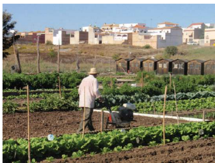
Hortelano trabajando en los huertos sociales de Villamartín (Cádiz)

En el contexto de este boletín, se entienden los huertos sociales de autoconsumo como espacios compartidos para el desarrollo de cultivos no profesionales, en los que se promueve la utilización de técnicas agrícolas acordes con la producción ecológica, teniendo sus cosechas como destino el autoconsumo y no la comercialización.