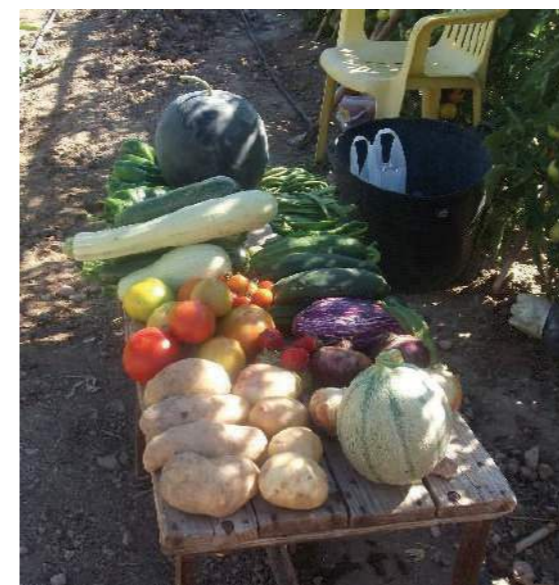
Cosecha en los huertos sociales de Pulpi (Almería)

unidos para compartir esta actividad, que vienen a sumarse a esta fuerte tendencia de aparición de huertos de carácter comunitario.