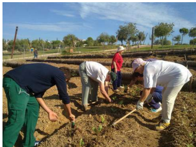
Trabajo comunitario en el huerto social Parque de la Asomadilla (Córdoba)

En la campiña, por su parte, existen muchos trabajadores del campo pero pocos propietarios de tierras, lo que justifica que los ayuntamientos cedan en usufructo a la ciudadanía pequeñas parcelas de cultivo para autoconsumo.