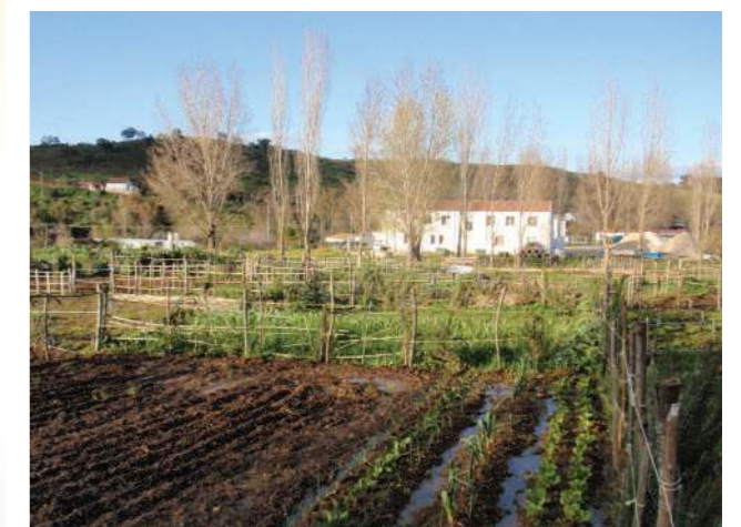
Huertos sociales de Cazalla de la Sierra (Sevilla)