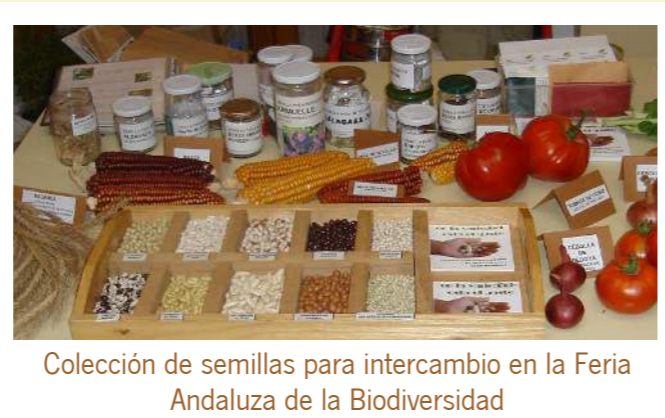
Colección de semillas para intercambio en la Feria Andaluza de la Biodiversidad