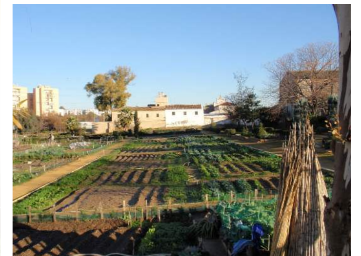
Panorámica de los huertos del Parque de Miraflores