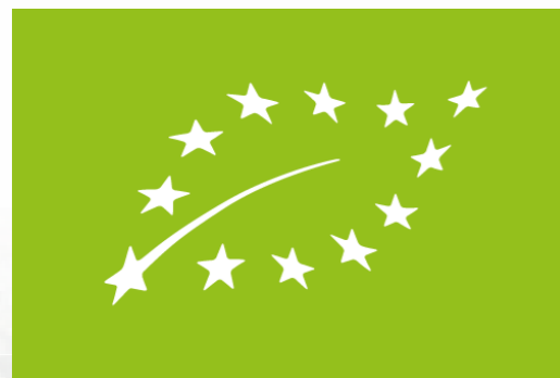
Logotipo europeo de la producción ecológica

Hoy en día es cada vez más fácil encontrar sobres de semillas ecológicas de una amplia variedad de hortalizas y plantas aromáticas. Suelen estar disponibles de viveros, centros de jardinería, semilleras y grandes superficies. Para encontrarlas deberemos, entre otra información que aparece en los sobres, localizar alguno de los términos protegidos "ecológico o biológico" en la parte frontal, asociado a la denominación del cultivo y/o su variedad. Adicionalmente, se debe poder localizar el logotipo europeo de la producción ecológica, que es obligatorio en las semillas que cuentan con certificación de este tipo.