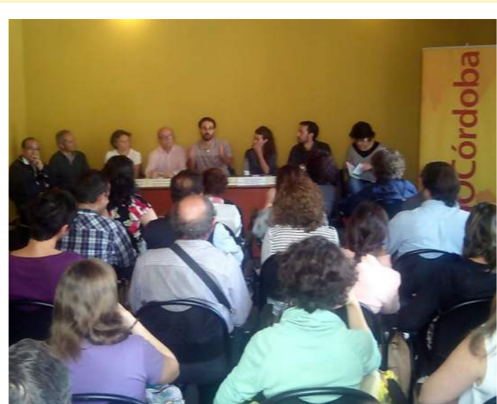
Presentación de ponentes en la mesa redonda

En primer lugar, se constituyó una mesa redonda donde se contó con la participación de personas pertenecientes a diversos huertos urbanos de Andalucía, que dieron a conocer, a los allí presentes, sus distintos proyectos. A continuación, se establecieron cinco grupos de trabajo con el objetivo de identificar de forma participativa las certezas, dudas y dificultades a las que se enfrentan las personas en torno a esta actividad. Por último, se realizó una puesta en común, de todos los grupos, y se debatió sobre las posibles mejoras y actuaciones que se podían llevar a cabo con la finalidad de incentivar la creación de nuevos huertos sociales de autoconsumo, así como la consolidación de los ya existentes en la Comunidad Autónoma de Andalucía.