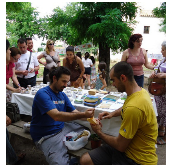
Intercambio de semillas en los Huertos del Rey Moro de Sevilla

Ya sea con hortelanos profesionales ecológicos o con los propios aficionados de los huertos sociales, el intercambio de semillas es una de las mejores formas de conseguir variedades tradicionales adaptadas a las condiciones de los pequeños huertos. El contacto entre los propios huertos sociales puede contribuir en buena medida.