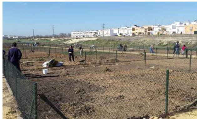
Nuevos huertos sociales de Arahál