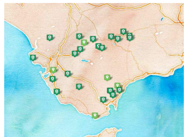
Ubicación de los huertos en la provincia de Cádiz.

El mapa de huertos de ocio actualmente cuenta con 27 localizaciones. Para 13 de estas existe información detallada consistente en: año de fundación, tamaño de parcelas, periodo de préstamo, existencia de cuarto de aperos, asociacionismos de los hortelanos, imagen de los huertos y ubicación.