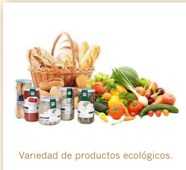
Variedad de productos ecológicos.

2. ¿Qué podemos esperar de los alimentos ecológicos? Los alimentos ecológicos se caracterizan por tener una alta calidad organoléptica y nutricional. Son productos obtenidos mediante técnicas respetuosas con el ritmo de crecimiento de plantas y animales, con el medio ambiente, la salud y el bienestar de los animales y la salud de las plantas.