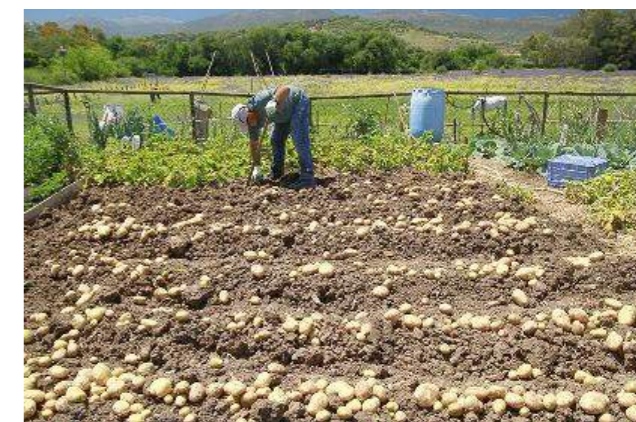
Hortelano de Los Barrios cosechando patatas.

Los hortelanos que participan en estos huertos se comprometen a hacer un uso racional del agua; tener el huerto en buenas condiciones de mantenimiento; no realizar construcciones ni