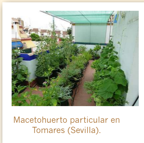
Macetohuerto particular en Tomares (Sevilla).

Es habitual que, debido a la creciente conciencia ambiental y sobre la salud, una buena parte de estas iniciativas estén relacionadas con prácticas agroecológicas, como: evitar el uso de agroquímicos, utilizar materia orgánica para incrementar la fertilidad del suelo y fomentar una amplia biodiversidad de animales y plantas, utilizando variedades tradicionales de cultivo o fomentando la presencia de insectos auxiliares.