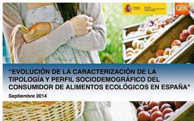
Portada del trabajo de investigación publicado por el MAGRAMA.

El cuidado de la salud y la nutrición son los principales motivos por los que se consumen productos ecológicos al considerarse “más naturales y de calidad superior”. Esa es una de las conclusiones de un estudio realizado en 2014 por el Ministerio de Agricultura, Alimentación y Medio Ambiente que se ha publicado bajo el título ‘Evolución de la caracterización de la tipología y perfil socioeconómico del consumidor de alimentos ecológicos en España’ .