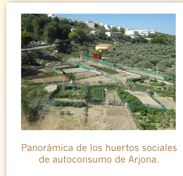
Panorámica de los huertos sociales de autoconsumo de Arjona.

Los huertos se ubican en lo que fue un solar degradado en la zona de La Redonda, al norte del municipio, entre el pueblo y los campos de olivar. Tras la limpieza y adecuación del espacio se procedió a la delimitación de 21 parcelas de unos 80 m 2 cada una, las cuales están divididas en 2 bloques, separados por un pequeño arroyo. Cuentan con 2 pozos cuya agua se almacena en un depósito común, para posteriormente ser aplicada a través de riego por goteo. A los huertos se accede por una rampa, a través del Parque del Llano, ubicados ligeramente por encima, en donde cuentan con un aparcamiento y una zona de esparcimiento con mesas, sillas y una pista de petanca.