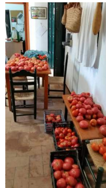
Preparativos de una cata de tomates.

Es cada vez más habitual entre las personas aficionadas a la horticultura de autoconsumo producirse sus propias semillas a partir de variedades tradicionales conseguidas por diversos medios. Normalmente se suele conservar más cantidad de la que posteriormente se utiliza, por lo que el intercambio es interesante tanto para dar difusión a las variedades propias como para obtener otras que probar e incluir en las colecciones personales. Esta interesante acción