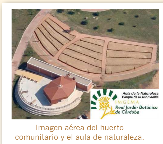
Imagen aérea del huerto comunitario y el aula de naturaleza.

El proyecto cuenta con un reglamento de uso que detalla que las adjudicaciones se realizan por periodos anuales; que sólo puede practicarse agricultura ecológica; que se constituirá una comisión con los usuarios para tratar los asuntos que afecten a la marcha de los huertos; que se fomentará la cooperación y el aprendizaje colectivo, etc. La comunidad hortelana ha de comprometerse a hacer un uso racional del agua; tener el huerto en buenas condiciones de