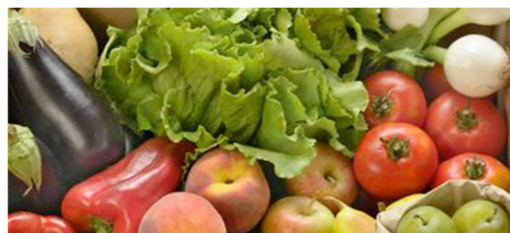
Variedad de productos ecológicos.

La calidad de un alimento es un concepto complejo, que viene determinado por factores muy variados, como son: las características organolépticas (vista, olor y sabor), la salubridad (aportación de elementos positivos para la salud) y el respeto medioambiental.