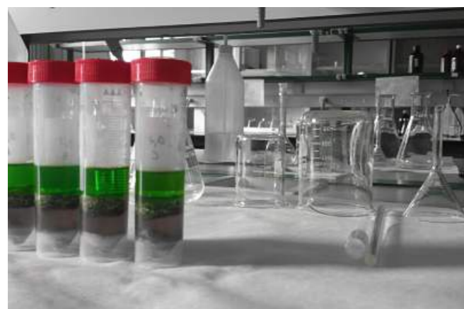
Imagen de un laboratorio de trazabilidad.

Si aún así los problemas persisten, pensaremos en utilizar algún tipo de sustancia autorizada en agricultura ecológica, pero siempre con criterio, aplicándolo de forma muy localizada sobre el problema y pensando en que tenga el menor impacto sobre los insectos auxiliares. Hay que pensar que hay sustancias de amplio espectro o muy específicas, como por ejemplo el 'Bacillus thuringiensis', específico para larvas de mariposa.