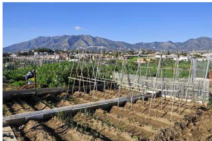
Panorámica de los huertos sociales de Mijas.