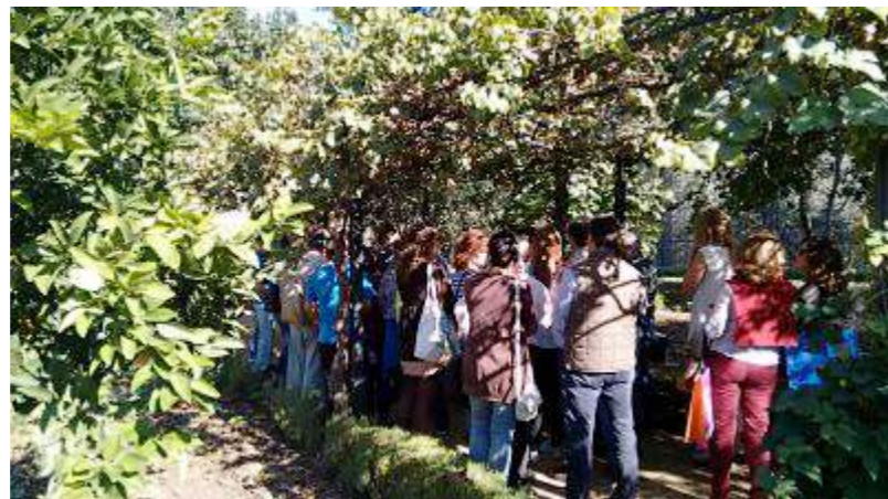
Visita a la zona agrícola del Jardín Botánico de Córdoba con motivo del encuentro.

En lo que se refiere a recabar recursos, especialmente, públicos se concluyó que una propuesta de Red de Huertos Sociales de Andalucía debería transitar de modelos informales a