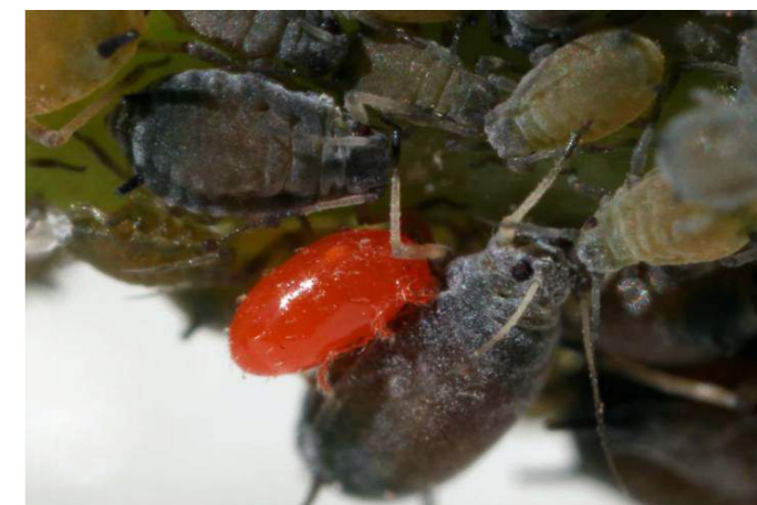
Ácaro autóctono parasitando a pulgón.

Es propio de las personas hortelanas que empiezan a cultivar preguntarse que productos son los más adecuados para mantener a raya las plagas y enfermedades que pueden afectar a la horticultura ecológica. Frente a la visión de mero control mediante la aplicación de sustancias químicas, que debe ser siempre la última alternativa, existe una batería de medidas de manejo encaminadas a, precisamente, evitar la aparición de estos seres incómodos que pueden dar al traste con la cosecha.