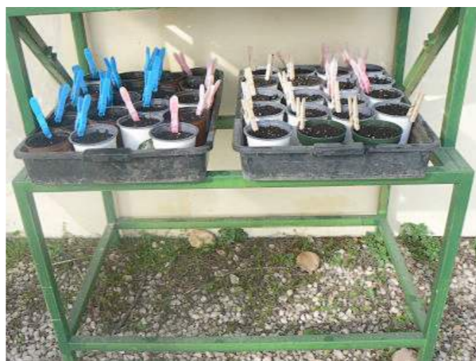
Zona de semilleros en Hacienda de Quinto.

Se ha habilitado una zona específica que, además de contar con las condiciones necesarias para la germinación y crecimiento de las semillas, pueda servir como muestrario de semilleros contruidos con diferentes materiales. Los semilleros sirven para que las plantas se desarrollen en sus primeros estadios, con condiciones de crecimiento más controladas, para que una vez que alcancen el desarrollo adecuado puedan ser trasplantadas a los distintos tipos de huertos con los que se está experimentando en las instalaciones de la Hacienda de Quinto.