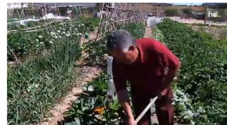
Un hortelano en una de las parcelas de 'Un huerto, una familia' de Pulpi.

El Ayuntamiento de Pulpi, en la provincia de Almería, ha desarrollado el proyecto denominado 'Un huerto, una familia' para "dar la oportunidad a numerosas familias del municipio de producir sus propias frutas y verduras en una finca propiedad de la empresa Primaflor, la cual pone a disposición de las familias seleccionadas parcelas de 250 m2 cada una".