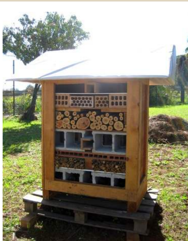
El hotel de insectos de la Hacienda de Quinto en Sevilla.

Además de su utilidad para los huertos experimentales de Hacienda de Quinto, el ‘hotel de insectos’ tendrá una función pedagógica, de manera que los distintos colectivos que visiten las instalaciones de Andalhuerto puedan conocer sobre el terreno los efectos beneficiosos que tiene la fauna auxiliar en los cultivos y cómo promover su presencia en sus propios huertos urbanos.