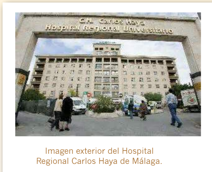
Imagen exterior del Hospital Regional Carlos Haya de Málaga.

El Hospital Regional Carlos Haya ofrece todos los días un menú ecológico completo a 20 pacientes que no tienen fijada una dieta terapéutica. La medida se ha iniciado entre los enfermos ingresados en los dos pabellones de Carlos Haya y está previsto extenderla a pacientes que se encuentran hospitalizados en el Civil y en el Materno Infantil.