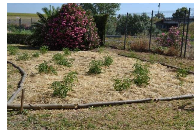
Huerta a la seca del proyecto Andaluerto.

En la actualidad, la mayoría de las semillas que se utilizan en los huertos requieren riego, pero no siempre fue así. La antigua "huerta a la seca" se desarrollaba en Andalucía solo con el agua de las lluvias gracias a técnicas agrícolas específicas y al uso de semillas que aceptaban este tipo de manejo.