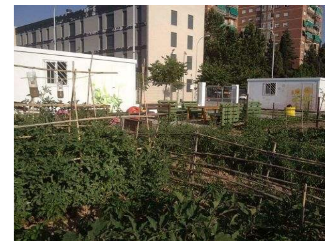
Panorámica de los huertos Nortelan@s La Madraza.

La Agencia de Vivienda y Rehabilitación de Andalucía (AVRA) diseñó un proyecto de desarrollo de barrios desfavorecidos en el marco del programa transfronterizo Habitar 2.0, en la zona Norte de Granada. Parte de este proyecto consistió en la implantación de huertos sociales ecológicos destinados al autoconsumo. Nortelan@s La Madraza surgió así como una forma de transformar el barrio y sus habitantes, en el contexto de estas prácticas agroecológicas y comunitarias. Una conexión de dos periferias urbanas, el barrio del Almanjáy, por un lado, y la Vega y sus cultivos, por el otro