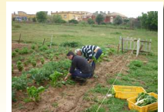
Huerto Ecológico “LA TOMATERA” de ASPRODEME

Hasta ahora, el tipo de cultivo realizado es el cultivo múltiple, ya que tiene la ventaja de plantar diferentes productos asociados a la misma porción de tierra.