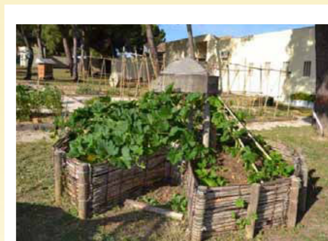
Ojo de Cerradura de los huertos de Hacienda de Quinto de AGAPA, en Dos Hermanas (Sevilla)

Para completar la información de los materiales para el montaje, así como los pasos para la construcción, se puede consultar la ficha completa en la web de AGAPA. Dentro del Proyecto Ecológico de Andalhuerto, se dispone de una Central de Ensayos y Experimentos ubicada en la Hacienda de Quinto en Dos Hermanas (Sevilla), enfocada a la investigación e innovación con técnicas y recursos encaminados a la eficiencia energética y la autosuficiencia en el manejo de los huertos, así como para servir de lugar de difusión e intercambio de experiencias, donde se han montado dos experiencias de Huerto de Ojo de Cerradura.