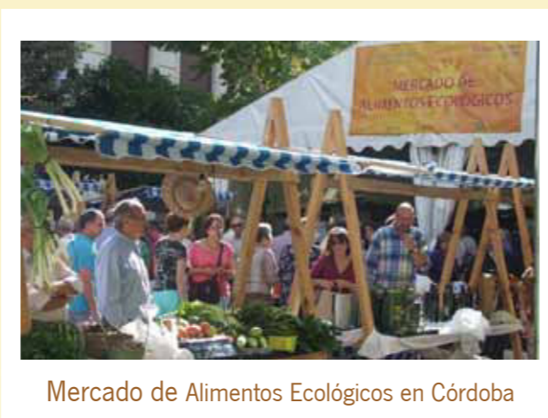
Mercado de Alimentos Ecológicos en Córdoba

El Consejo de Gobierno ha aprobado el decreto que regula la venta directa al consumidor de 22 tipos de productos primarios agrarios y forestales. La norma contribuirá a mejorar la viabilidad económica de unas 183.000 explotaciones profesionales andaluzas (más del 75% del total y en su mayor parte de pequeños agricultores y recolectores), al permitir una comercialización sin costes de intermediarios y con un mayor valor añadido. Asimismo, facilitará a los consumidores el acceso a alimentos autóctonos de calidad, obtenidos a partir de sistemas tradicionales que no suelen llegar a la gran distribución.