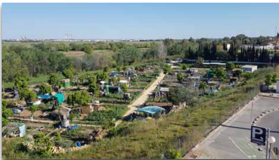
La nueva ley promoverá la interconexión con las zonas periurbanas

En concreto, el borrador, en su artículo 2 sobre desarrollo urbanístico sostenible, contempla que, entre otros, la actividad urbanística se regirá por el siguiente principio: “La transformación del espacio público como eje estructurante de los núcleos de población y la recalificación de las zonas verdes urbanas, su biodiversidad y capacidad de sumidero de carbono y de regulación de la temperatura, mediante la creación de una red de zonas verdes, de sistemas naturales, huertos urbanos y agricultura de proximidad periurbanas y de espacios rurales interconectados, a través de corredores verdes y la incorporación de la vegetación en los tejidos urbanos, mejorando la resiliencia de las ciudades ante los efectos del cambio climático.