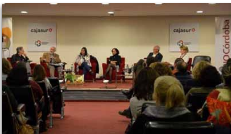
Ponentes de la Jornada "Los alimentos Ecológicos, buenos para tu tierra, buenos para ti"

Más de un centenar de personas asistieron a esta jornada denominada "Los alimentos Ecológicos, buenos para tu tierra, buenos para ti", donde se contó con la participación de expertos internacionales y nacionales en la materia. Las personas asistentes pudieron profundizar en los conocimientos y compartir experiencias sobre la importancia de la alimentación ecológica y el papel que juega la población consumidora en el freno y adaptación al cambio climático.