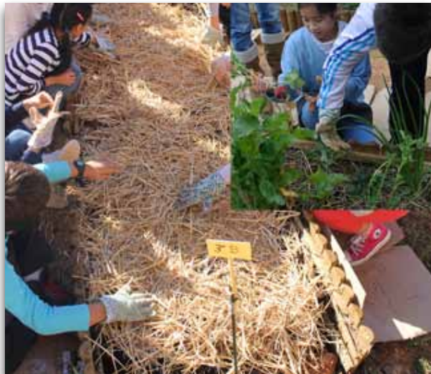
Alumnado de infantil aprendiendo a cultivar en el huerto del CEIP

El proyecto de huerto se inició en el curso 2010-2011, y en el curso 2013-2014 se termina de implantar en todo el centro (con un bancal de aproximadamente 6 m 2 para cada grupo-clase). El huerto ocupa dos parcelas, para el caso de Primaria, una de 360 m 2 (con los bancales de los cursos) y otra común de 450 m 2 dedicada a "bosque de alimentos". Además, en el patio trasero de cada aula de Infantil, existe un pequeño huerto de unos 4 m 2 .