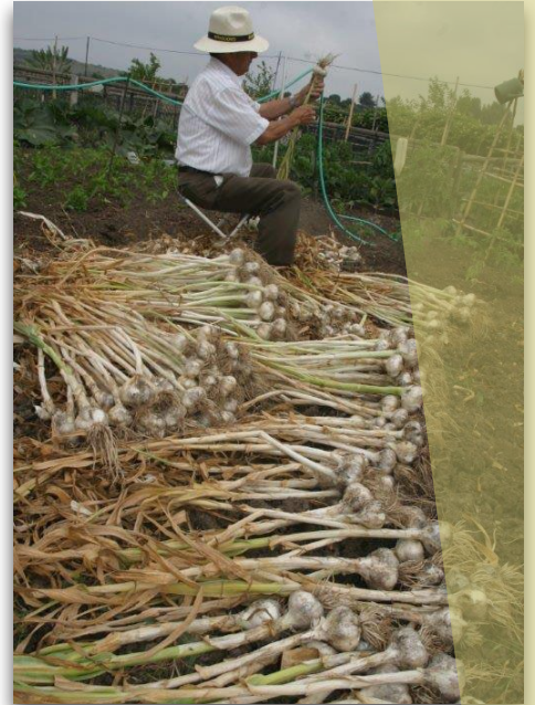
Es imprescindible avanzar en el cambio del actual modelo productivo

Los seres vivos ofrecen una serie de beneficios que hacen posible tanto la agricultura como el mantenimiento de la propia vida en el planeta. “Por ejemplo, un beneficio muy claro es la producción de oxígeno por parte de algas y plantas. Pero hay muchos más. Cualquier sistema en el que haya vida se beneficia del incansable trabajo de organismos que hacen posible, entre otras muchas cosas, la polinización, el control de plagas, la retención y reciclado de nutrientes en el suelo, o un uso efectivo de los recursos”.