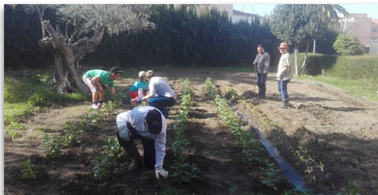
Siembra en grupo