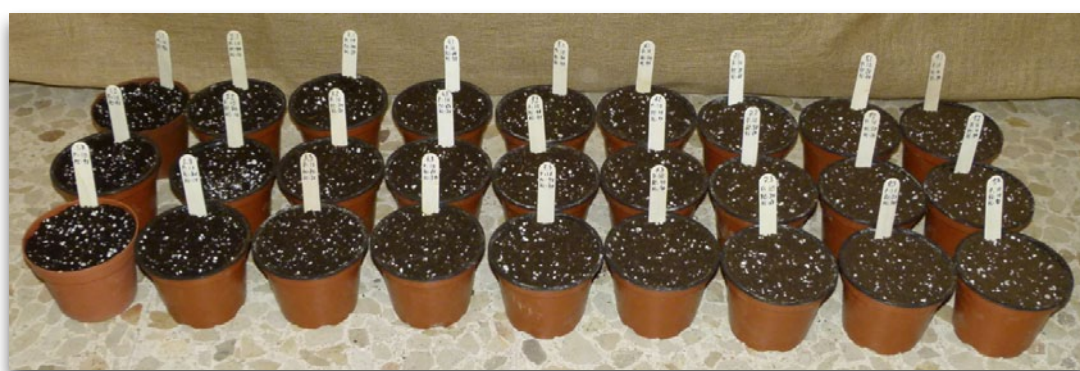
Puesta en marcha del experimento