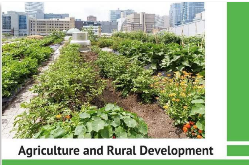
Agricultura urbana y periurbana.

"Investigación para el Comité AGRI- Agricultura urbana y periurbana en la UE" es un estudio que presenta una visión general del estado del arte sobre la agricultura urbana y la agricultura periurbana (UPUA), la diversidad de fenómenos, motivaciones, características distintivas, beneficios y limitaciones. La UPUA está contextualizada en relación con las transformaciones sociales y económicas, los objetivos estratégicos de la UE, las políticas y los enfoques del sistema alimentario regional. Utilizando ejemplos de mejores prácticas, el estudio demuestra la necesidad de una mejor integración de UPUA en la agenda de políticas en todos los sectores, dominios y niveles de gobierno.