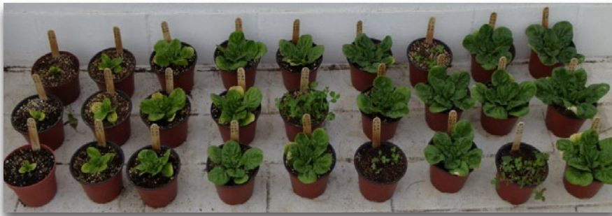
Estado final de crecimiento de las plantas

A la hora de elaborar los sustratos, conforme va aumentando la proporción de humus de lombriz y disminuyendo la fibra de coco, el color va pasando de negro a pardo. Además, conforme va aumentando la proporción de humus de lombriz, el sustrato se va haciendo menos esponjoso, lo que se nota al presionar con la mano. Esto es un indicio de un posible mayor poder de aireación y retención de humedad de la fibra de coco respecto al humus de lombriz. El amarilleamiento que se observa en el último día del experimento puede tener distintas causas. En el caso de las plantas menos abonadas, la razón es precisamente esta. En el caso de las más abonadas, las razones pueden ser dos. Por una parte, el ataque de minadores, que prefieren las hojas de las plantas más abonadas. Por otro lado, el problema de estrés hídrico que tuvieron que soportar las plantas más grandes en un determinado día de fuerte insolación.