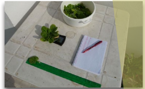
Medición del peso y tamaño de la hoja