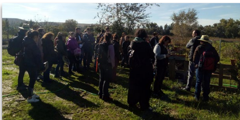
Aula de Agroecología para Mujeres del Medio Rural en Córdoba. 27 de noviembre de 2018

Si quiere puede ampliar información sobre las Aulas de Agroecología en la web de la Consejería de Agricultura, Ganadería, Pesca y Desarrollo Sostenible.