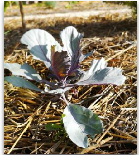
El acolchado incrementa la materia orgánica del suelo