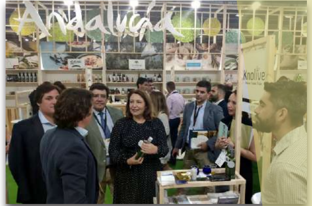
La consejera de Agricultura, Ganadería, Pesca y Desarrollo Sostenible, Carmen Crespo, en el stand de la Junta de Andalucía en Organic Food Iberia

Las 123 empresas participantes en Organic Food Iberia corresponden a las ocho provincias andaluzas: 35 de Sevilla, 24 de Jaén, 20 de Almería, 16 de Córdoba, 10 de Granada, 7 de Huelva, 6 de Cádiz y 5 de Málaga. Además, muchas de éstas están agrupadas a su vez gracias a la participación de las diputaciones provinciales de Jaén y Sevilla, la Asociación Ecovalia, la Asociación Landaluz y tres Consejos Reguladores, los de las denominaciones de calidad de Baena, Aceituna Aloreña y Sierra de Segura. Respecto a los productos destacan las frutas y hortalizas, aceite de oliva, jamones y embutidos, cárnicas, frutos rojos, subtropicales, conservas vegetales, aceitunas, vinos, vinagres y bebidas espirituosas, cervezas artesanas, panadería, bollería y dulces.