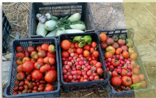
Las variedades tradicionales se adaptan bien a las condiciones cambiantes.

Las semillas de variedades tradicionales tienen una alta diversidad genética, lo que les permite contribuir a la adaptación general del huerto a condiciones adversas de temperatura y humedad, así como a posibles desequilibrios que puedan fomentar la aparición de insectos y hongos.