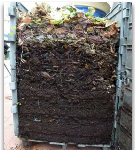
El compostaje doméstico aprovecha la materia orgánica de los hogares