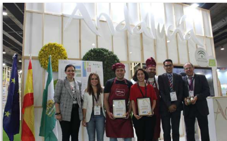
Aceituna Aloreña y Delinatur, empresas andaluzas premiadas en Organic Food Iberia

En este sentido, y según recogen las encuestas de satisfacción iniciales, la mayor parte de las empresas andaluzas que han concurrido a la feria Organic Food Iberia volverían a repetir la experiencia, mientras que la valoración general del evento entre el tejido productivo ha sido muy positiva. Además, según los organizadores de la exhibición, las expectativas de participación con las que contaban en un inicio se han visto dobladas en cuanto a profesionales visitantes.