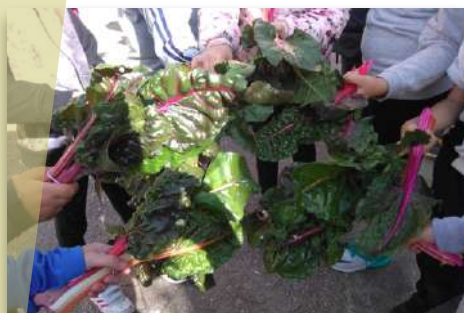
Cosecha de acelgas rojas por el alumnado del CEIP Reyes Católicos

El programa pretende, a través del ciclo vital de los cultivos, introducir al alumnado en los cuidados del huerto y las plantas, descubriendo la importancia del suelo, el agua y la luz en el desarrollo de éstas. También se persigue diferenciar y conocer frutas y hortalizas, descubrir los frutos de temporada y propiciar una alimentación saludable a través de las recetas elaboradas con las familias, desarrollando valores como la autonomía personal, el respeto, el trabajo en equipo, igualdad, tolerancia, etc.