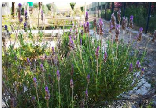
Las aromáticas dan cobijo y comida a los insectos.

Las plantas aromáticas aportan un plus a los huertos ya que ayudan al mantenimiento de la biodiversidad de estos. Sirven de atrayentes de fauna auxiliar, que ayudará a mantener el equilibrio ecológico del medio, de abejas y demás insectos polinizadores y, además, muchas de ellas segregan sustancias inhibitoras de la germinación de semillas silvestres, así como sustancias favorecedoras del enraizamiento de algunos cultivos. Las plantas aromáticas aumentan las posibilidades de adaptación de los insectos y otros seres vivos a un clima con temperaturas crecientes.