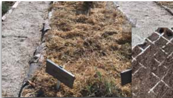
Trasplante de crucíferas y protección de los plantones

No olvidemos proteger los cultivos del ataque de pájaros y otros “visitantes” en estas primeras semanas con mallas antipájaros, o con protecciones tubulares.