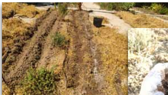
Preparación del lecho de siembra

... en el caso de contar con sistema de riego , aprovechamos el cambio de cultivo para realizar la revisión de los distintos elementos del mismo (reparación, sustitución, reinstalación, etc). Podemos dejar el riego hasta que lleguen las primeras lluvias, y luego retirarlo hasta la primavera siguiente.