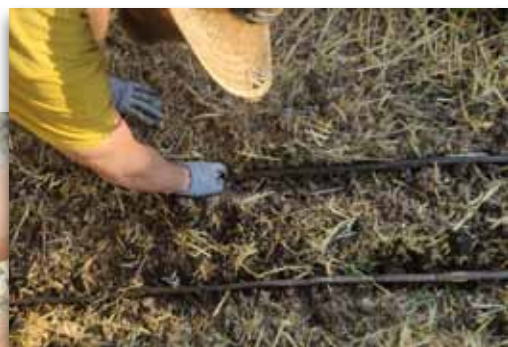
Revisión del riego