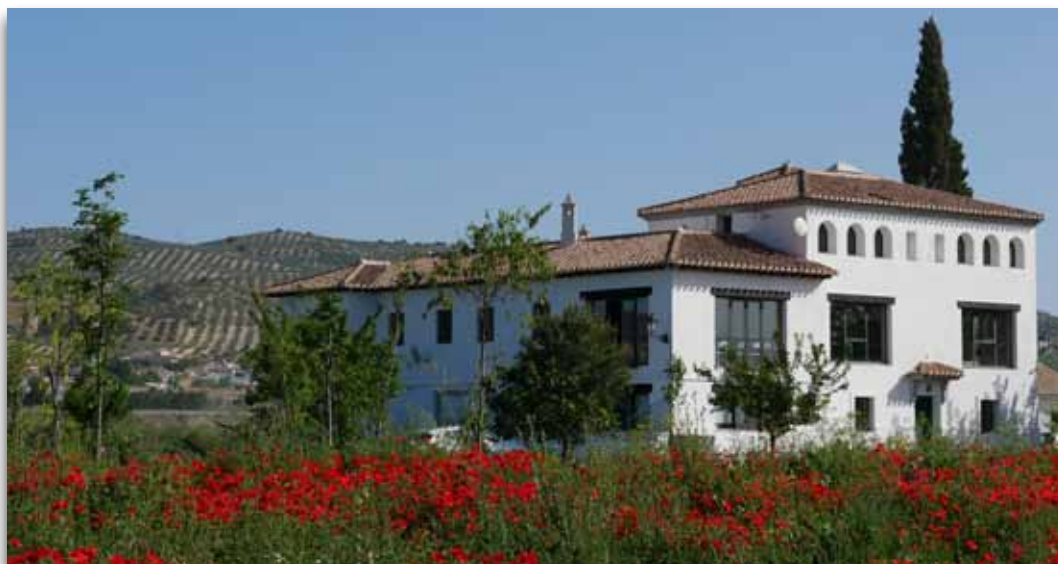
Cortijo en Pinos Puente. Casería Verdeval

El proyecto incluye la parte de producción en la propia finca de productos hortícolas, hierbas aromáticas y plantas ornamentales certificadas como ecológicas. Además de esta, recientemente, con el apoyo del Grupo de Desarrollo Rural Promovega (FEADER), se han ampliado y mejorado las instalaciones del antiguo cortijo para la manipulación, transformación y comercialización. Por otra parte, con los mismos fondos se han acondicionado los espacios del antiguo cortijo para albergar una Aula de formación y reuniones, un comedor para atenciones sociales y degustaciones, despachos para atención y dirección, así como servicios y vestuarios.