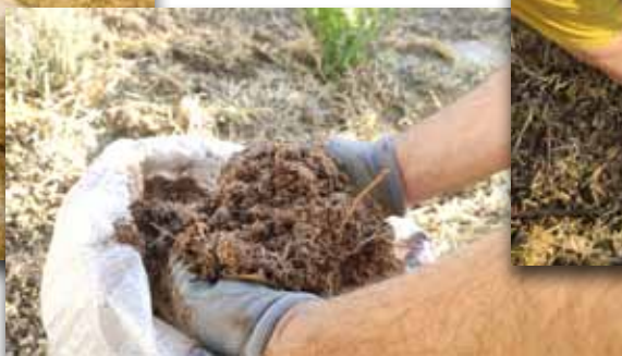
Aportación de estiércol