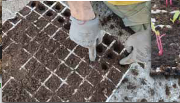
Preparando los semilleros