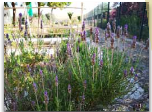
Aromáticas, nuestras aliadas

Más información: Qué hacer en el huerto en el mes de octubre