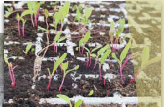
Plantones de acelgas rojas locales