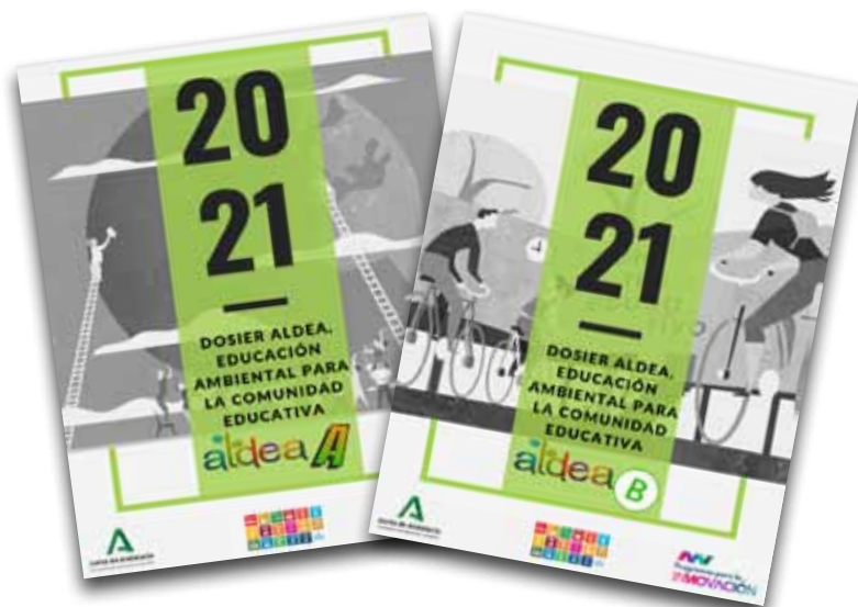
Programas ALDEA A y ALDEA B 2020-2021. Junta de Andalucía

Este año el inicio del curso es diferente al de otros años debido a la COVID19. Pero ello no supondrá un freno. Después de un arduo trabajo por parte de la Consejería de Educación y Deporte, los Programas para