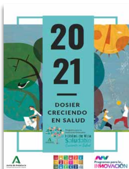
Programa Creciendo en Salud 2020-2021. Junta de Andalucía

Por otro lado, relacionado con los centros educativos que disponen de huertos, en este nuevo curso, se va a proceder al envío de 160 nuevos “Kit para Huertos escolares” , que se suman a los 891 enviados en convocatorias anteriores . Un recurso que se ofrece a los centros como medida de acompañamiento del Plan Escolar de Consumo de Frutas y Hortalizas de la Consejería de Agricultura, Ganadería, Pesca y Desarrollo Sostenible que se desarrolla en el marco del Programa para la Innovación Educativa, Hábitos de Vida Saludable dentro de su modalidad Creciendo en Salud . Esta modalidad ha sido solicitada por más de 2.025 centros educativos en el curso 2020/2021, (datos provisionales). El kit se compone de materiales para la preparación del terreno similares a las campañas anteriores, materiales para la implantación del sistema de riego y material vegetal con una amplia variedad de cultivos en distintos formatos: semillas ecológicas, plántones de otoño y de primavera que servirán para completar el ciclo anual agrícola. Además, ofrecerá un servicio de asesoría técnica para la adaptación y mejora de los huertos en centros escolares de Andalucía mediante 400 talleres en centros escolares.