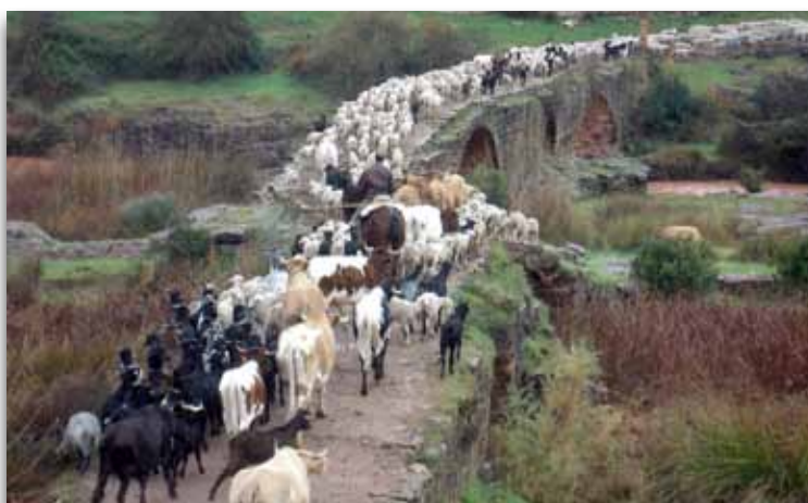
Ganadería en trashumancia (Jaén)