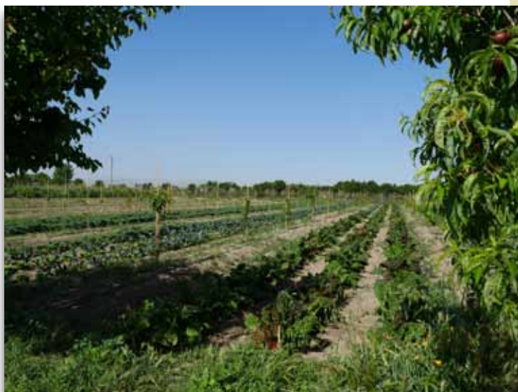
Asociación de frutales y hortícolas ecológicas. Casería Verdeval

Los productos ecológicos que se producen, se comercializan tanto a asociaciones de productores, como desde la asociación El Encinar de Granada (Federación Andaluza de Consumo y Producción Ecológica) y cooperativas, como tiendas minoristas de venta de productos ecológicos, siendo un complemento económico para el proyecto de integración social de las personas que en participan. En la actualidad la producción nutre a numerosos comercios especializados en consumo ecológico y responsable, tanto de la provincia de Granada como otras zonas limítrofes.