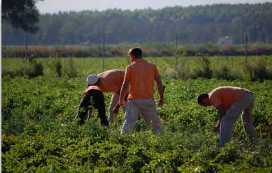
Trabajos agrícolas en los cultivos ecológicos. Casería Verdeval

Actualmente la Fundación cuenta con un Centro Especial de Empleo en el que se desarrollan varias actividades, con unos niveles de eficiencia y calidad equiparables a cualquier empresa que compita en el mercado, sin perder por ello el componente social, el proceso de apoyo pedagógico y acompañamiento para la integración de las personas que en él trabajan. Tal y como comentan desde la propia Fundación, “estamos convencidos de que la apuesta por la sostenibilidad y el desarrollo de la agricultura ecológica influyen positivamente en las personas trabajadoras, impulsando su completa integración laboral y comunitaria.”