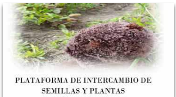
Inicios de la Red de Cádiz con el intercambio de semillas

La red comienza a organizar encuentros , lo que le permite detectar necesidades comunes sobre la falta de disponibilidad de semillas de los centros, de terreno y herramientas, de conocimientos para comenzar a montar un huerto, etc. La red creó un banco de semillas pequeño y un banco de plantas discreto. El funcionamiento de la red se basa en la organización de encuentros y reuniones organizadas por la red y seguir sumando sinergias e iniciativas. Esos encuentros se organizan en estos “5 rincones con encanto”, unas instalaciones ubicadas en distintos lugares emblemáticos de Cádiz como Jerez, los Toruños o las Salinas Romanas de Iptuci (entre Grazalema y los Alcornocales).