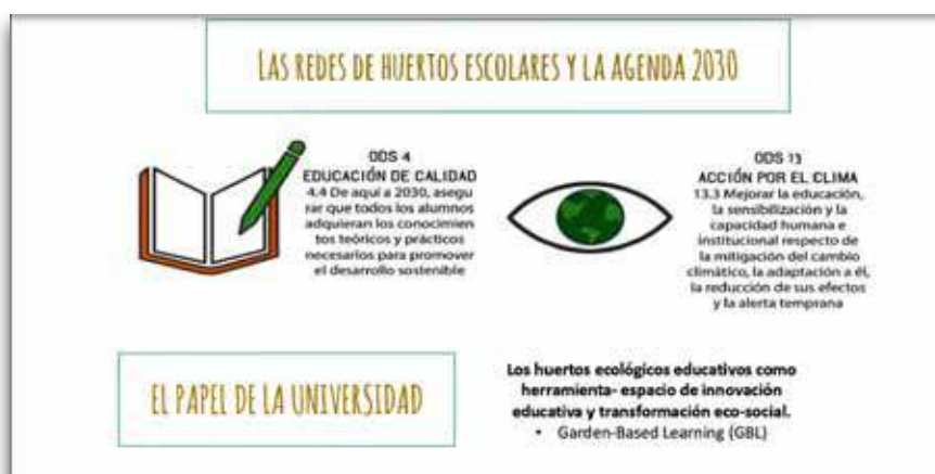
Las redes de huertos escolares y la agenda 2030

Comenzó compartiendo la experiencia de la Red de Universidades Cultivadas, que surge como iniciativa por parte de algunas universidades para responder a la necesidades de formar a futuros/as maestros y demostrar los beneficios de introducir los huertos ecológicos como actividad curricular y extracurricular en todos los niveles educativos.