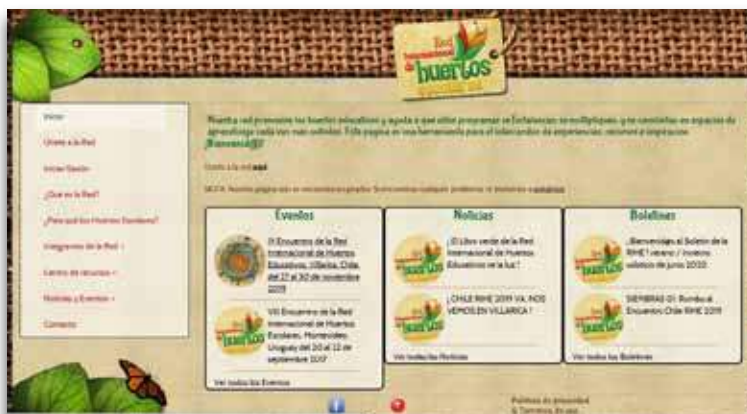
Red Internacional De Huertos Escolares