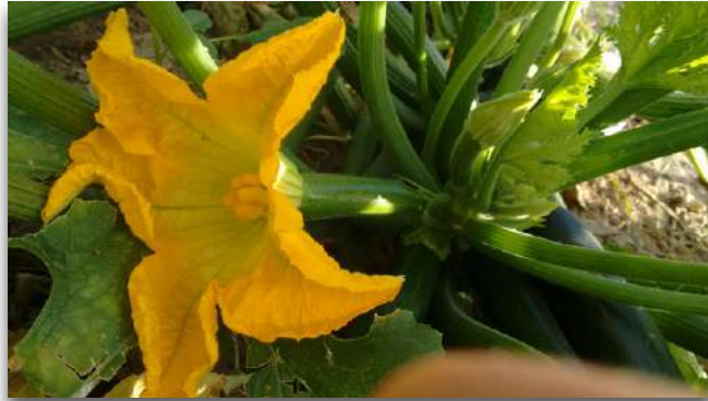
Flor masculina (izquierda) y femenina (derecha) de calabacín

Tras la floración tiene lugar la polinización , el polen de las anteras ha de situarse en contacto con el óvulo del ovario para que comience la fecundación .