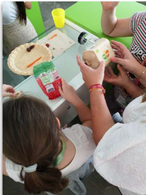
Taller de identificación de alimentos ecológicos

Por otra parte, si los procesos para generar estos alimentos están libres de agroquímicos de síntesis, estaremos propiciando que no se deteriore nuestro entorno y nuestros propios organismos. Por tanto, la alimentación saludable y respetuosa con el medio ambiente es una cuestión de justicia social, de salud personal y global. El esfuerzo, sin duda, merece la pena.