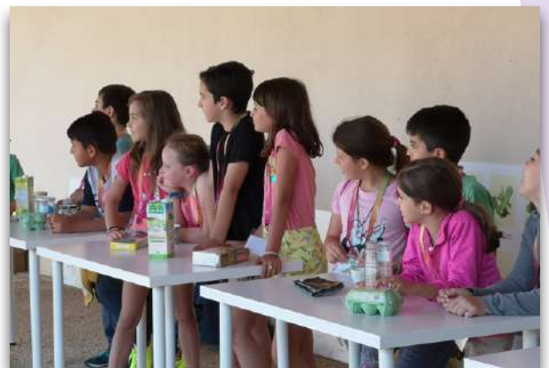
Taller "Alimentando tu futuro" con alumnado de Dos Hermanas (Sevilla)

Por eso cada una de nuestras acciones, hasta las más sencillas, interactúan y afectan a otros muchos elementos. Las acciones y sus repercusiones trascienden mucho más allá de nuestro entorno más próximo y condicionan la vida de otras personas. Es imprescindible comprender que existen unos recursos limitados y que nuestras necesidades pueden ser ilimitadas. Hay que priorizar para lograr un equilibrio en el entorno.