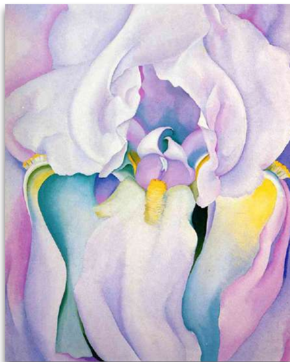
Georgia O'keeffe. La luz del lirio (1924)

Hace relativamente poco que fueron presentadas las evidencias científicas por las que sabemos que las plantas se reproducen sexualmente a través de sus órganos florales. Podríamos incluso poner fecha y nombre a dicho acontecimiento: 1694 con la aparición de la obra De sexu plantarum epistola del botánico alemán Rudolf Jakob Camerarius. Pero si hay alguien que ha sabido plasmar la sexualidad de las flores, ha sido la artista estadounidense Georgia O'keeffe.