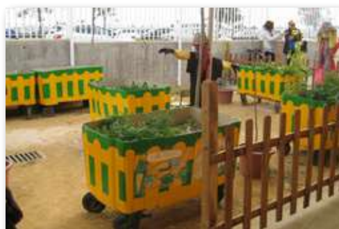
Huerto en contenedores