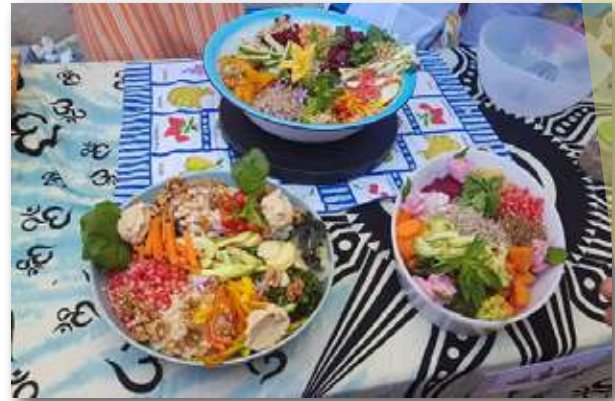
Platos preparados por cocinera durante el Ecomercado

Actualmente hay varios Ayuntamientos dispuestos a desarrollar nuevos ecomercados, cuestión que hay que ir valorando poco a poco y en la medida en la que haya más personas productoras adheridas a la RAC, cumpliendo con los reglamentos internos de los que nos hemos dotado para funcionar organizadamente.