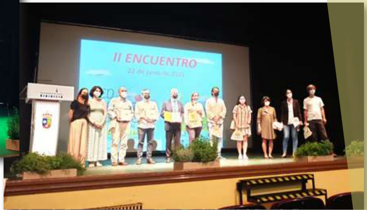
Foto de grupo de intervinientes en el evento