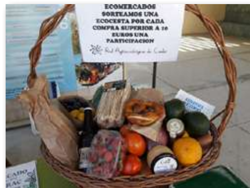
Sorteo cesta productos ecológicos durante el Ecomercado