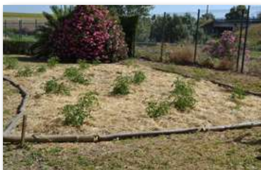
Huerta a la seca