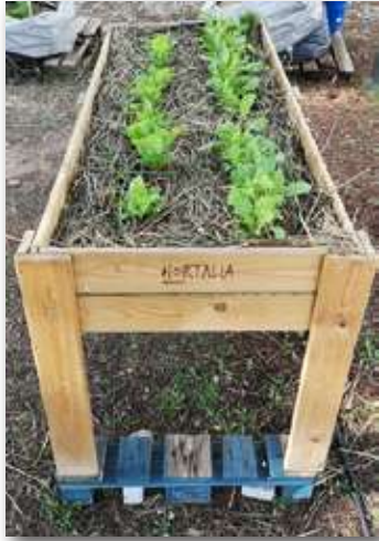
Mesa de cultivo