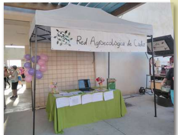
La Red Agroecológica de Cádiz (RAC)

A finales de 2014 se produce un primer encuentro de personas productoras en Cádiz y un segundo encuentro, en abril de 2015, sobre ecomercados, en el que nos acompañaron la Red Agroecológica de Granada, Guadalhorce Ecológico y COAG Sevilla. De aquí nace la Red Agroecológica de Cádiz (RAC) , constituida en noviembre de 2015 por 25 personas socias fundadoras, agricultoras, ganaderas, industrias artesanales, tiendas, restaurantes, empresas de educación ambiental y personas consumidoras a título individual apoyando la Agroecología en nuestra provincia. Actualmente somos 53 y queremos seguir creciendo como lugar de encuentro y de estructuración de la Agroecología en Cádiz .