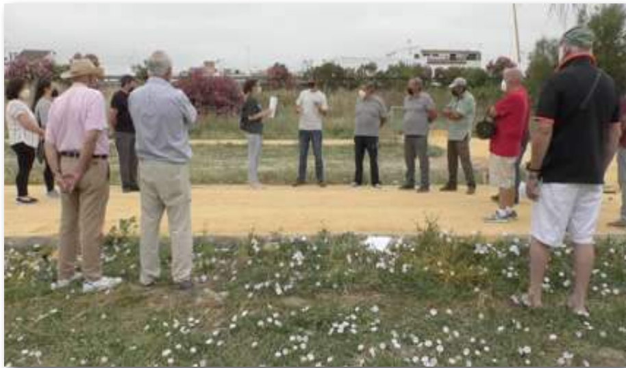
Un instante de la charla técnica ofrecida a las personas hortelanas de los huertos de Santiponce

Comenzamos el martes 14 llevando a cabo una charla introductoria en las nuevas parcelas que el Ayuntamiento de Santiponce va a poner en breve a disposición de la ciudadanía. Los huertos serán del disfrute, tanto de la experimentada comunidad hortelana procedente de un anterior emplazamiento, como de nuevos vecinos y vecinas que se acercan por primera vez al apasionante mundo de la horticultura y la soberanía alimentaria. La charla iba especialmente enfocada a los aspectos que hay que tener en cuenta para poner en cultivo por primera vez una parcela en huertos sociales. Se trataron entre otros aspectos: el tipo de suelo, las hierbas presentes y su manejo, las labores preparatorias, la organización del espacio en las parcelas, las modalidades de cultivos, el abonado orgánico y compostaje, las semillas a utilizar, el riego y el manejo de la agrobiodiversidad; todo desde un enfoque agroecológico, pues es la filosofía fundamental de Andaluerto. Aprovechamos la ocasión del evento para grabar un video divulgativo relacionado con esta temática que publicaremos en próximos boletines.