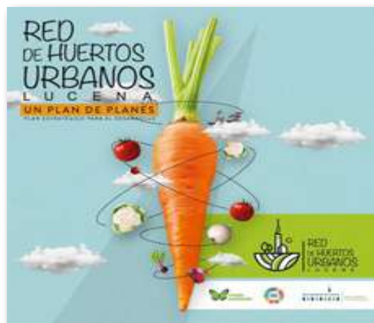
Red de Huertos Urbanos de Lucena

Como colofón, el día 22 de junio, Andaluerto fue invitado a participar en el II Encuentro de la Red de Huertos de Lucena en el que se presentó el nuevo Plan Estratégico para el desarrollo de la Red de Huertos Urbanos de Lucena. Este plan pretende construir una amplia red en el municipio y tiene la intención de contar con la participación ciudadana, a la que considera uno de sus pilares fundamentales. Es amplio, incluyendo toda la tipología posible de huertos urbanos de autoconsumo. Contempla, entre otros, los huertos sociales, terapéuticos, escolares y familiares, teniendo un claro interés por los macetohuertos, que entienden fundamentales para aquellas familias sin acceso a la tierra, mostrándose como un proyecto para toda la ciudadanía. Y como cabría esperar, muestra un enfoque hacia el uso de técnicas propias de la agricultura ecológica.