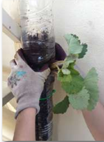
Huerto vertical de botellas pet

¡Ya no tienes excusa para montar tu huerto!