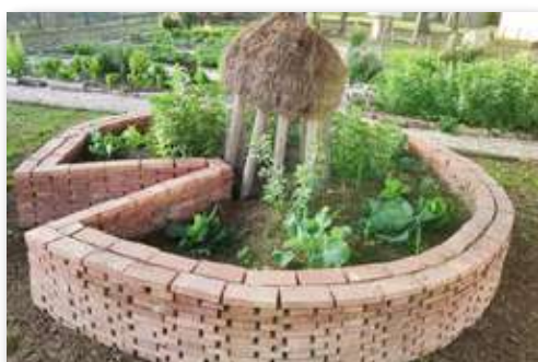
Ojo de cerradura