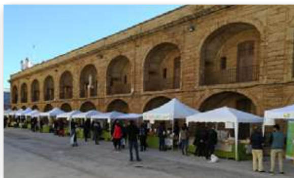
Ecomercados en Los Toruños (Valdelagrana-Puerto de Santa María) y en Cádiz (dcha.)