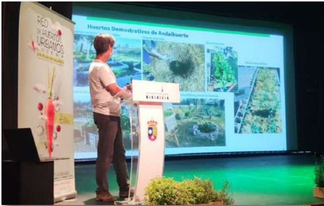
Intervención de Andalhuerto sobre las redes de huertos

Tras la presentación del plan, Andalhuerto hizo una revisión sobre el estado de la cuestión al respecto de las redes de huertos urbanos . Se comenzó hablando tanto de la agricultura urbana y periurbana desde un enfoque agroecológico, como profesional y de autoconsumo, y la importancia de estas para conseguir ciudades más habitables, saludables y sostenibles. Posteriormente se realizó una revisión histórica de algunas de las redes de huertos urbanos de autoconsumo que han ido surgiendo desde el año 2014. Se habló tanto de intentos frustrados del pasado, analizando las causas, como de otros exitosos que siguen activos hoy en día, destacando las razones de dicho éxito. Todo ello con el objetivo de contribuir a allanar el camino en esta andadura que la Red de Huertos de Lucena acaba de iniciar.