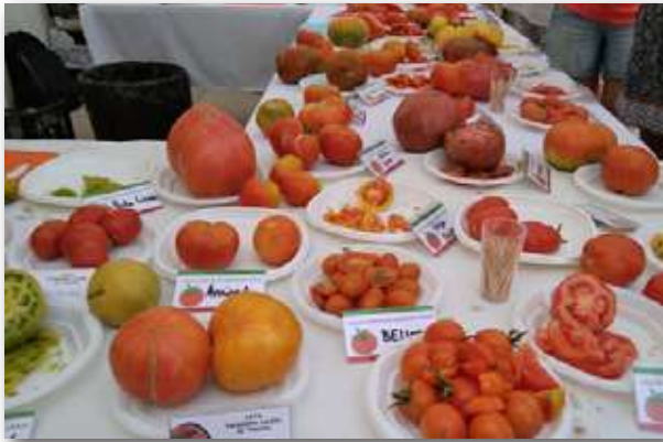
Cata de variedades tradicionales de tomate durante el Ecomercado